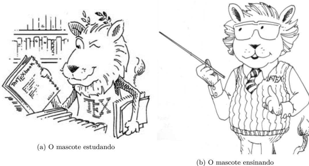
Figura 2 – O mascote do \text{\LaTeX} em diferentes poses

Essa é uma subseção da seção 2.1 do Capítulo 2 . Subseções como esta não deverão ser numeradas.